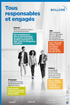
Poster « Tous responsables et engagés »