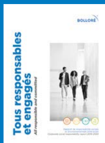
Rapport « Tous responsables et engagés »