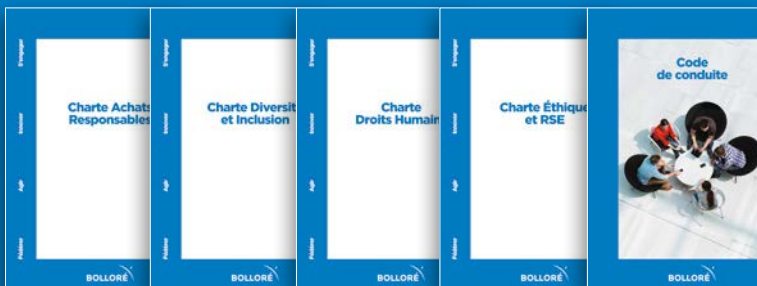
Code de conduite Dispositif des chartes