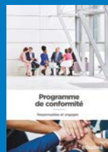
Programme de conformité